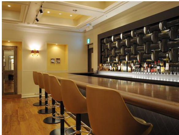
バーカウンター（6席）