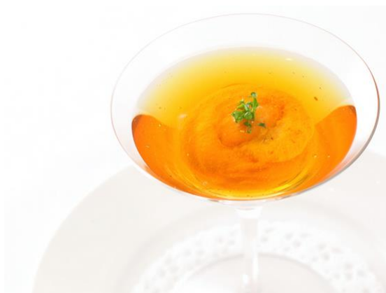
アルポルト スペシャルティ 「人参のムース 生ウニとコンソメゼリー」