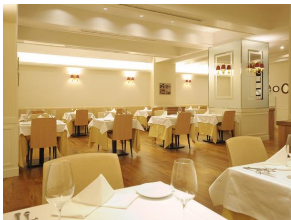
ダイニングイメージ（28席）