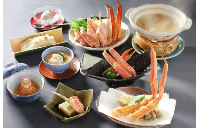
ずわい蟹一杯ひとり占め会席イメージ(日本料理「花城」)