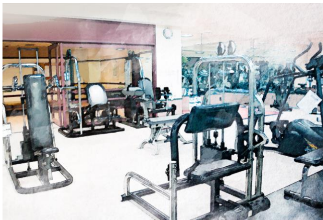
ジム ※完成イメージ