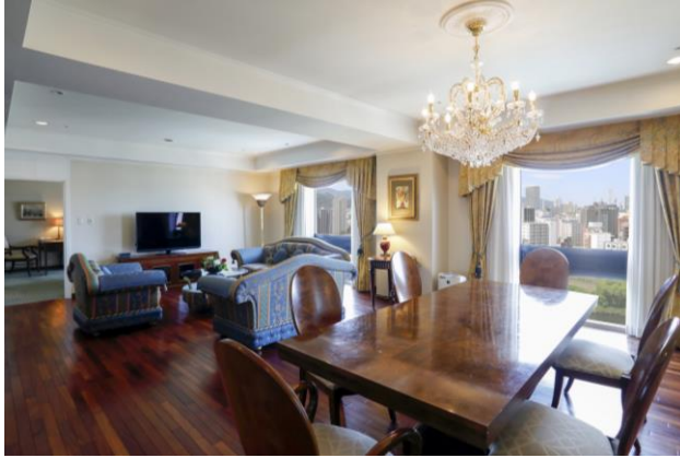
プレジデンシャルスイート(160平米)

20周年を記念し、「20」に因んだ特別価格でスイートルームや人気の客室にご滞在いただけるご宿泊プランをご用意いたしました。リビング・ダイニングを備え、160平米の広さを誇る最上級客室「プレジデンシャルスイート」でのラグジュアリーなひと時をお過ごしいただけるプランのほか、日本料理「花城」の『ずわい蟹一杯ひとり占め会席』が付いたプランなど、当ホテルならではの体験が楽しめるだけの感謝祭限定のご宿泊プランが登場します。ご宿泊期間は、10月14日(土)チェックイン～12月14日(木)チェックアウトまでです。