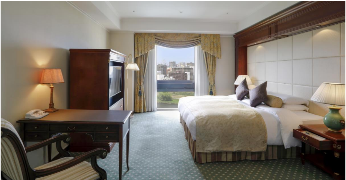
160平米の広さを誇るラグジュアリーな客室(一部)

20年に渡りホテルを支えてくださったお客様への感謝を込めて、「20」に因んだ特別価格のご宿泊プランを本日より販売いたしましたことをご知らせいたします。また感謝祭開催期間中は、合計100組に無料宿泊券が当たる抽選などの特別企画を実施いたします。