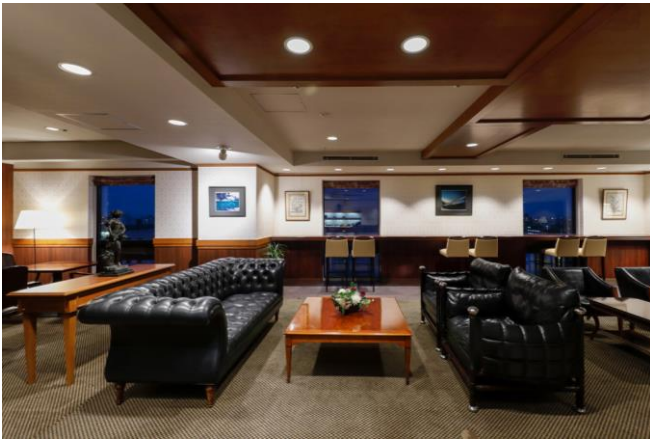
ステイタスラウンジ

コーヒーや紅茶、ソフトドリンク各種をご用意しており、ホテルでの時間をより快適にお過ごしいただけます。テレワークやお打ち合わせ等のビジネスとしての活用はもちろん、ホテル滞在中の気分転換やお食事前の一杯のご利用など、様々なシーンに合わせ、ご利用ください。