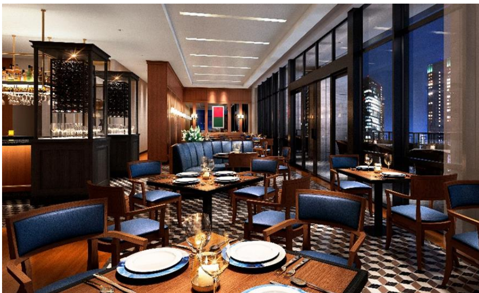
Ocean Milano Seafood & Roast Beef（オーシャンミラノ）

ジャズやボサノバのBGMと横浜の夜景が演出する大人な空間で、会話が弾み、ワインも進むことでしょう。記念日や接待、プロポーズなど、特別で非日常的なシーンにも最適です。時間を忘れて特別な夜をお過ごしください。