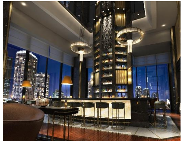
Bar & Lounge Melody (メロディー) ボトルタワー