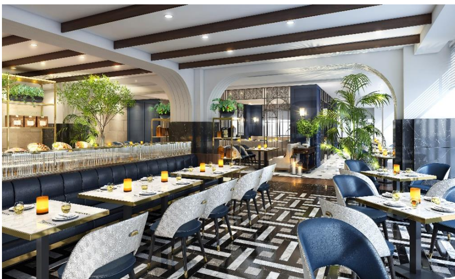
Allday Dining Parade（パレード）

店内はアール・デコ様式の庭園をコンセプトに、各所にグリーンの柔らかさを取り入れ、中央に西洋の庭園に見られるガゼボから着想を得た空間を配置。横浜の港を思わせる鮮やかなネイビーブルーや、石畳を連想させる床が印象的な、カジュアルにご利用いただけるレストランです。