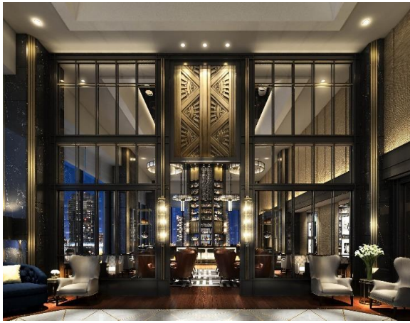
Bar & Lounge Melody (メロディー) 入口