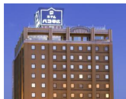
プレミアホテル-CABIN-帯広