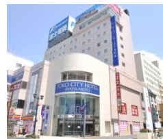
プレミアホテル-CABIN-松本