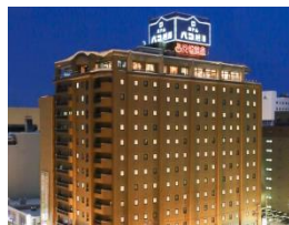
プレミアホテル-CABIN-旭川