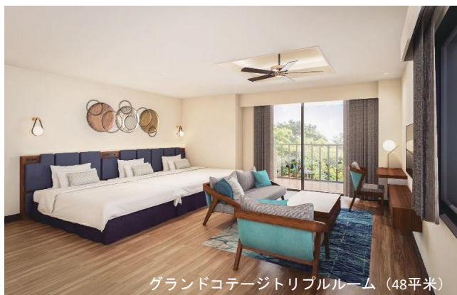
グランドコテージトリプルルーム (48平米)