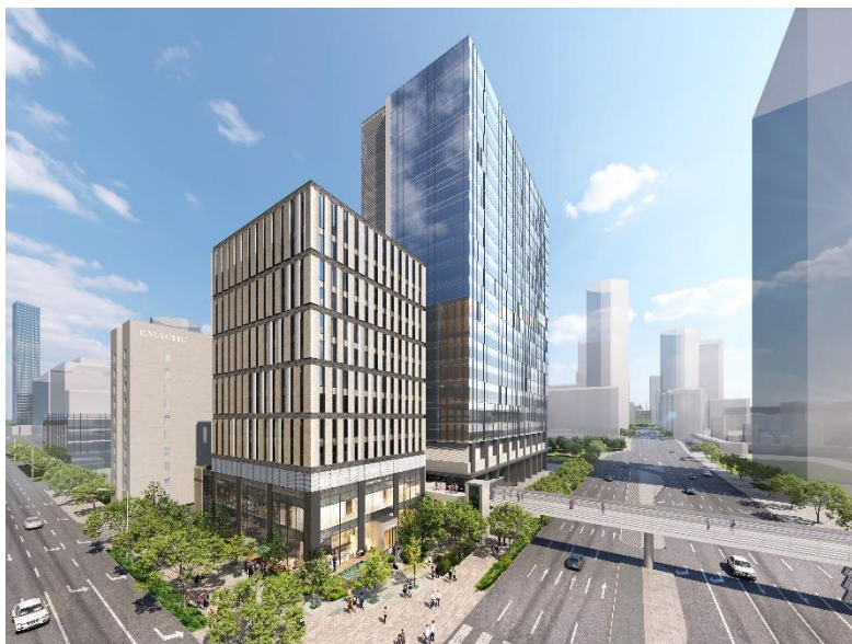
ホテル外観 (イメージ)

本プロジェクトは、三菱地所株式会社がオフィス棟とホテル棟の開発を進めている『(仮称) 晴海三丁目計画新築工事』のうちホテル棟を指すもので、竣工後に株式会社ケン・コーポレーションが三菱地所株式会社より譲渡を受け、プレミアホテルグループ(ケン不動産リース株式会社)がホテルとして運営するものです。なお、自社ブランド「 プレミアホテル-CABIN PRESIDENT- 」は、大阪、函館に続く全国3施設目の出店となります。