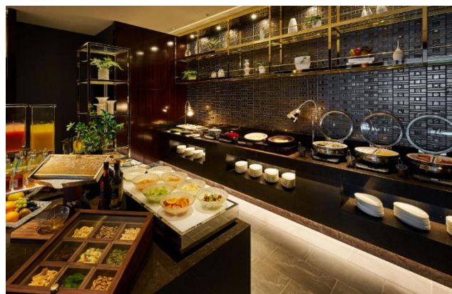
エグゼクティブラウンジ

またホテル館内にはレジャーやビジネスのお客様のあらゆるニーズに対応した 3 つの料飲施設を備えています。