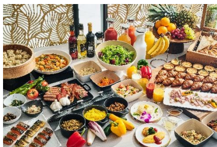
オールデイダイニング「パレード」料理イメージ

またホテル館内にはレジャーやビジネスのお客様のあらゆるニーズに対応した 3 つの料飲施設を備えています。