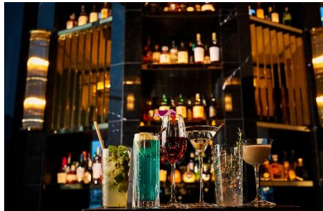
バー&ラウンジ「メロディー」

ジャズやボサノバのBGMと横浜の夜景と共に、銘柄牛と新鮮なシーフードをコースメニューでお楽しみいただける高級感とカジュアルさを兼ね備えたレストラン。シーフードからお肉まで網羅するコースメニューを揃え、100種類のワインセレクションと合わせてご堪能いただけます。記念日や接待、プロポーズなど特別で非日常的なシーンにもおすすめです。