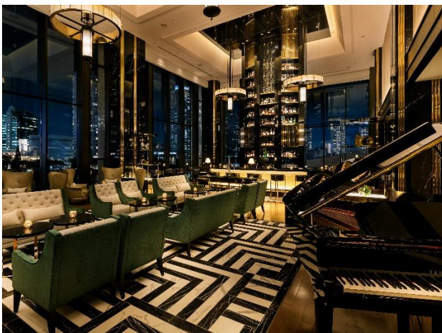
アール・デコのデザインをモチーフにしたバー&ラウンジ「メロディー」

建築様式のアール・デコをモチーフに、モダンな横浜の要素を組み込み再構築した「YOKOHAMA Déco (ヨコハマ・デコ)」がホテル全体のデザインコンセプト。アール・デコは、神奈川県庁本庁舎などの歴史的建築にその造形が多くみられ、そのきらびやかな豪華さと未来的なスタイリッシュさを取り入れながら、横浜の海、港町や音楽のイメージと掛け合わせたこのホテルならではのデザインを施しています。