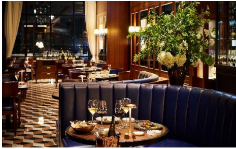
スペシャルティレストラン 「オーシャンミラノシーフード&ローストビーフ」