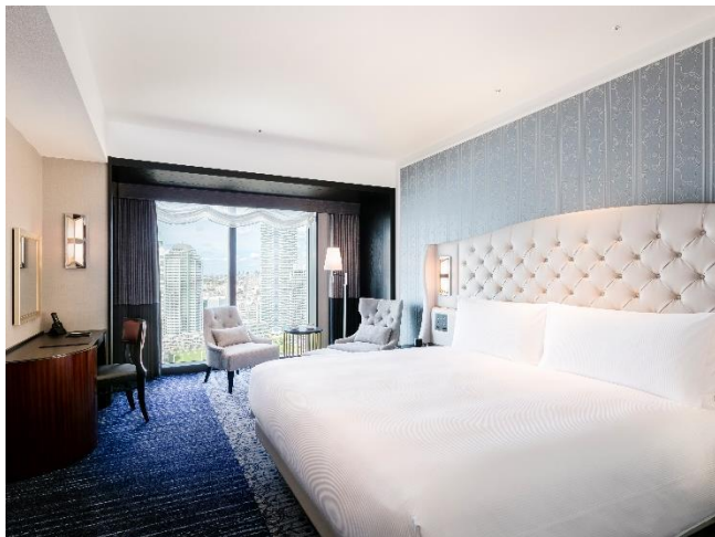
客室「プレミアムルーム」(39 平米)

スイート 20 室を含む全 339 室の客室は、アール・デコの特徴的な装飾やデザインを配置し、横浜の夜景に溶け込むエレガントな配色。客室には、まるで横浜の夜景の中に浮かんでいるかのように感じる造りの足元まで全面に広がった窓や、客室でも音楽の余韻に浸れるよう高性能スピーカーを備え、上質で寛ぎに満ちた滞在を提供します。