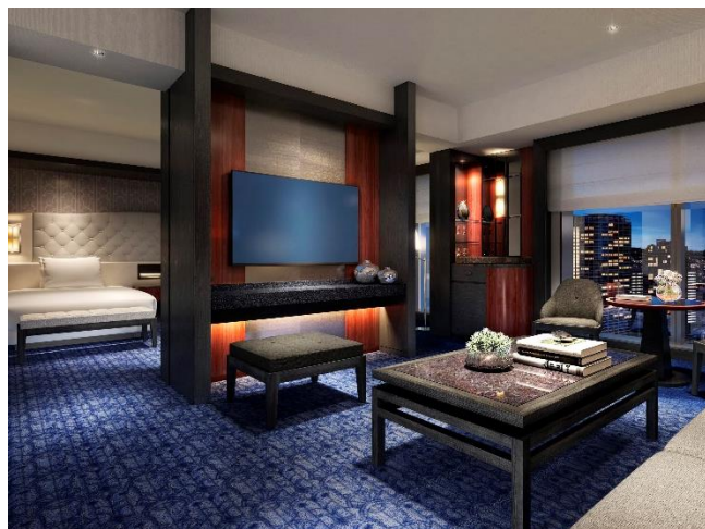
客室「エグゼクティブスイートルーム」(81 平米) ※イメージパース

ホテル 5 階には、スイートルームやエグゼクティブルームに宿泊のお客様専用エグゼクティブラウンジを設け、エグゼクティブラウンジを利用されるお客様専用のチェックインカウンターをご用意しています。同ラウンジでは、朝食やカクテルタイムの時間に合わせたサービスを提供します。また音楽やアートの書籍を配したライブラリスペースも備え、移ろいゆく横浜の景色を眺めながら思い思いの時間をお楽しみいただけます。